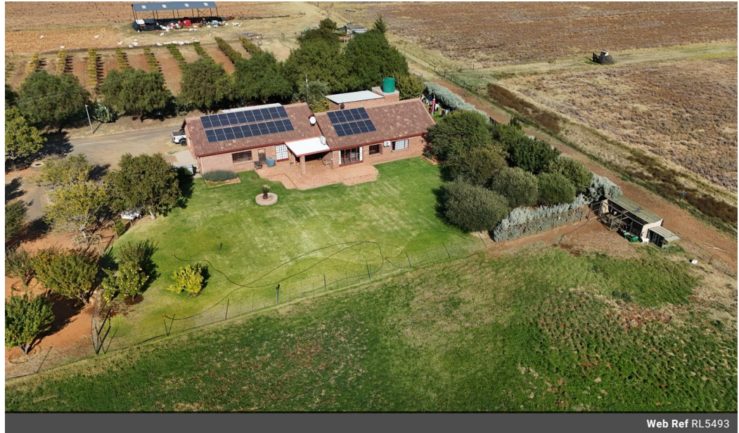
Web Ref RL5493

Shop 26 Pretty Gardens Langenhoven Park Bloemfontein